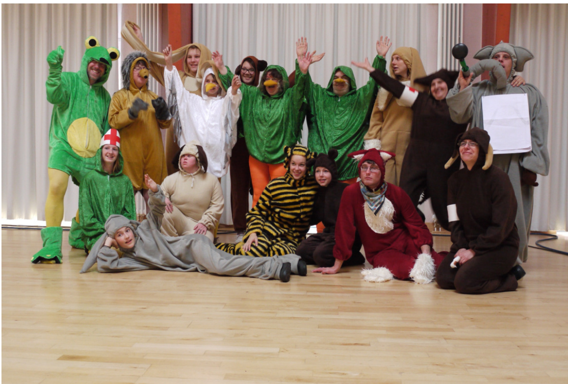
Bei der Musical-Probe im Bürgerhaus Romrod