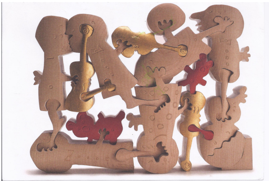
„Fest der Begegnung?!“